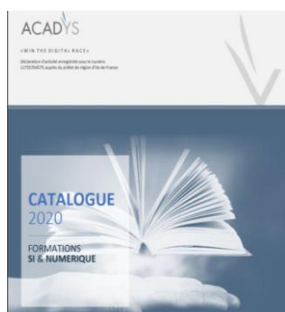
Catalogue 2020 de nos formations