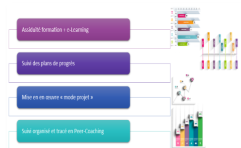
Tableau de bord suivi efficacité des formations

Votre entreprise bénéficie encore du dispositif d'activité partielle ? Vous souhaitez former vos collaborateurs pendant la période de chômage ? Profiter du dispositif FNE*