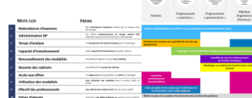
Matrice opportunités-segments client

Des fiches d'actions aux impacts analysés sur les faits et les actions de l'entreprise des professionnels pour et